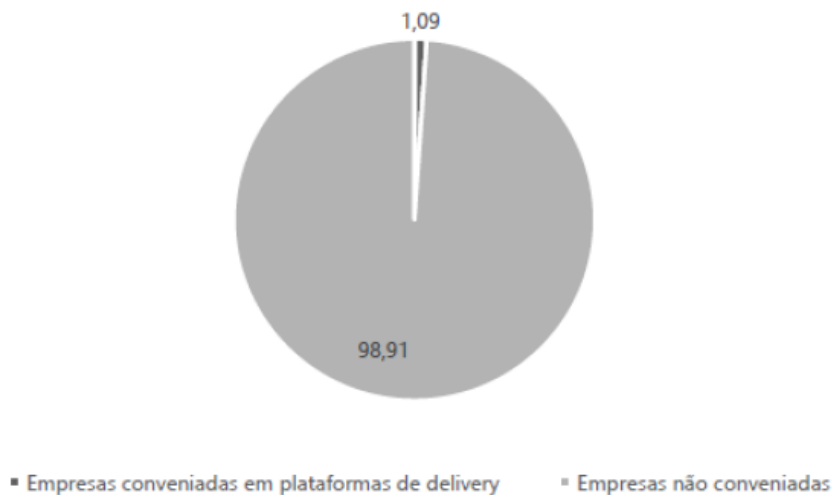
Empresas com CNAE de "Emissão de Vales-alimentação"

Das 549 empresas atuantes no ramo, apenas 6 preenchem o requisito imposto pela Administração. Isso diminui desproporcionalmente o rol de potenciais participantes do presente certame. Quase 99% do mercado foi excluído da disputa: